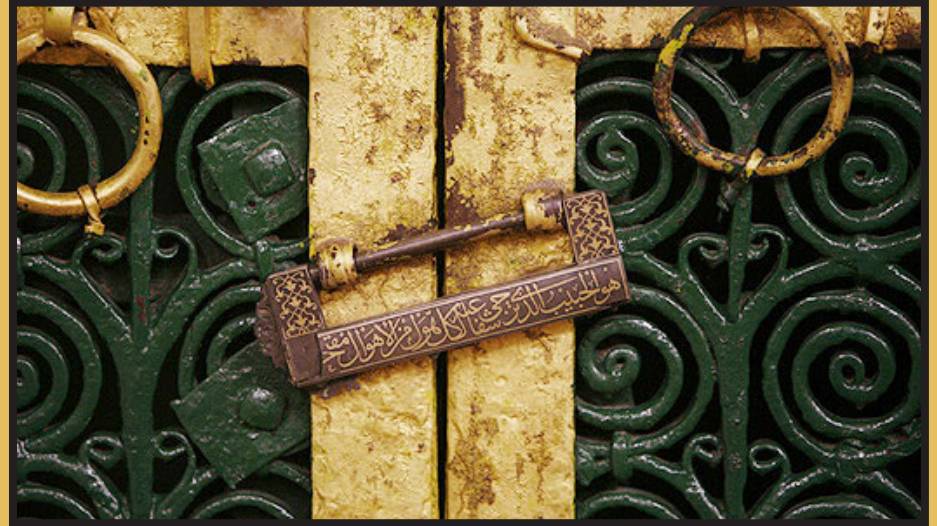
زيارة الصديقة الشهيدة فاطمة الزهراء (عليها السلام)