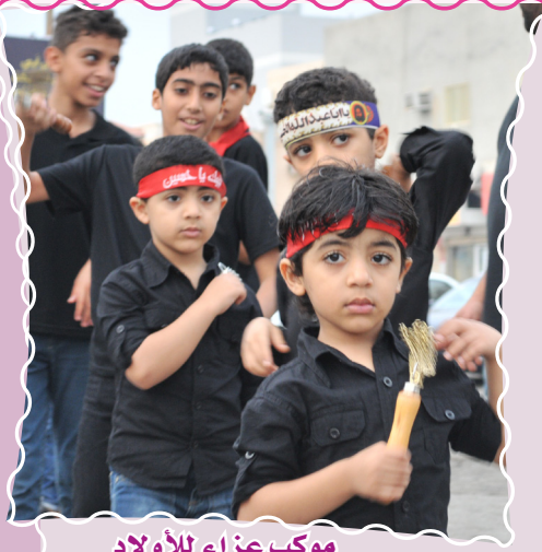
موكب عزاء للأولاد