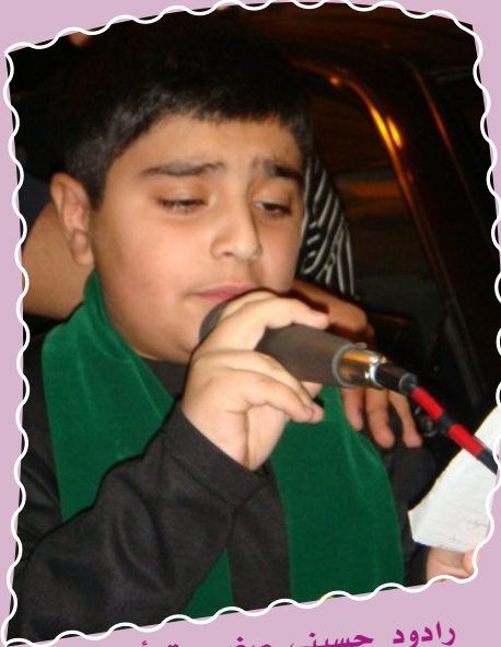
رادود حسيني صغير يقرأ في موكب عزاء خاص بالأطفال