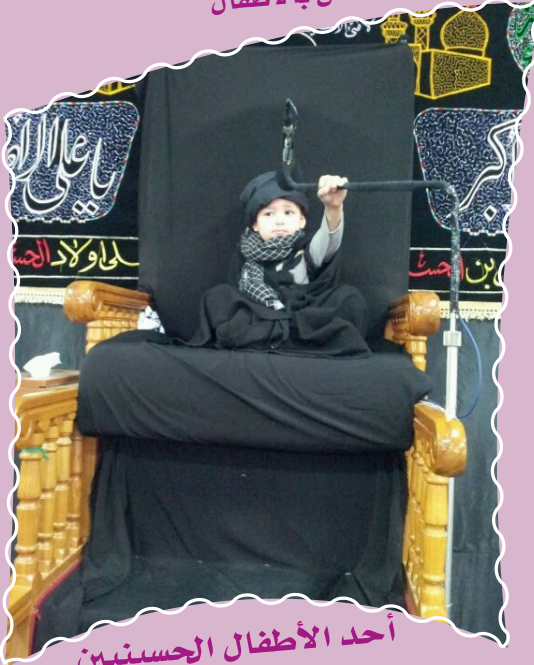
أحد الأطفال الحسينيين على المنبر