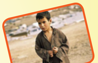
اللهم اكس كل عريان