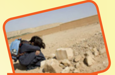
ادخل على أهل القبور السرور