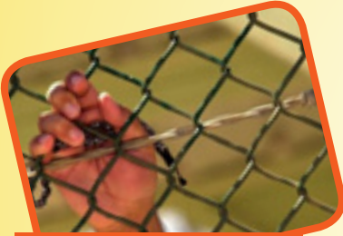
اللهم فك كل اسير