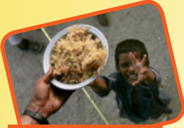
اللهم اشبع كل جائع

عن النبي (ص) أنه قال : من دعا بهذا الدعاء فمن رمضان بعد كل فريضة غفر الله له ذنوبه إلى يوم القيامة..